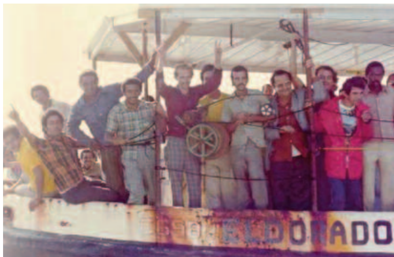
Refugiados en el puerto de Mariel

Miles de cubanos estaban saliendo de Cuba para buscar una nueva vida en Estados Unidos. Yo también quería buscar una nueva vida. Pero tenía miedo porque sabía que en Cuba, era peligroso buscar la libertad.