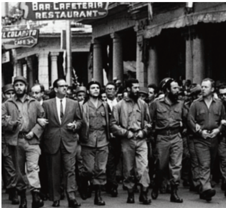
Izquierda a derecha: Fidel Castro, Osvaldo Dorticós Torrado, Che Guevara, y otros revolucionarios marchan en La Habana en 1960

Miles de cubanos escaparon de Cuba inmediatamente después de la Revolución. Muchos se fueron a vivir a Miami, Florida. Los cubanos querían a su país y tenían la intención de regresar en el futuro... cuando Castro ya no controlara la isla.