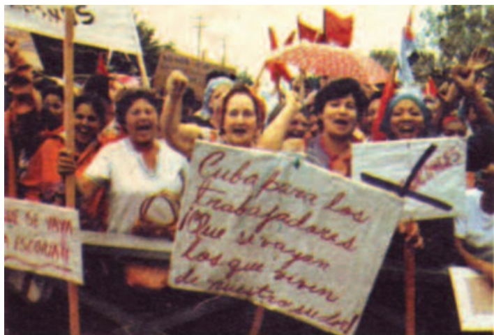
Protestas durante el éxodo de Mariel

a Cuba nunca. Mi plan era simple: ir a casa, ver a mi familia, regresar rápidamente al puerto y salir en secreto en un barco.