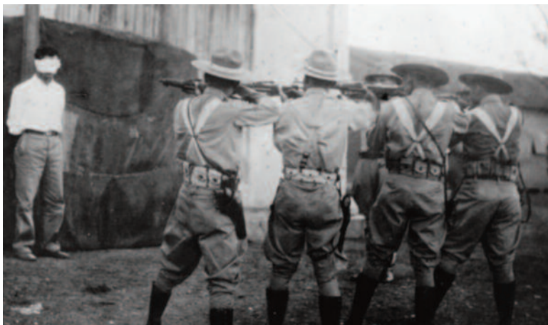
Soldados de Fulgencio Batista asesinan a un revolucionario, 1956

En 1952 (mil novecientos cincuenta y dos), Fulgencio Batista –un expresidente– tomó el control de Cuba por un golpe militar 1 . Tenía el título de ‘presidente’ otra vez, pero en realidad, Batista era un dictador brutal que usaba tácticas terroristas para mantener el control de Cuba. Además, Batista estableció relaciones con cubanos ricos y con políticos de Estados Unidos, y permitió que Estados Unidos controlara la economía y la industria del azúcar.