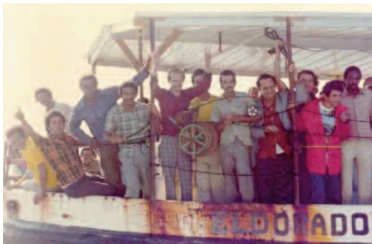
Refugiados en el puerto de Mariel

Había rumores de que muchos cubanos –que ahora vivían en Florida– estaban regresando a Cuba para buscar a sus familiares. Navegaban sus barcos a Cuba para llevar a sus familiares a Estados Unidos. Muchos cubanos salían de Cuba para buscar una nueva vida en Estados Unidos. Yo también quería buscar una nueva vida. Quería buscar la libertad.