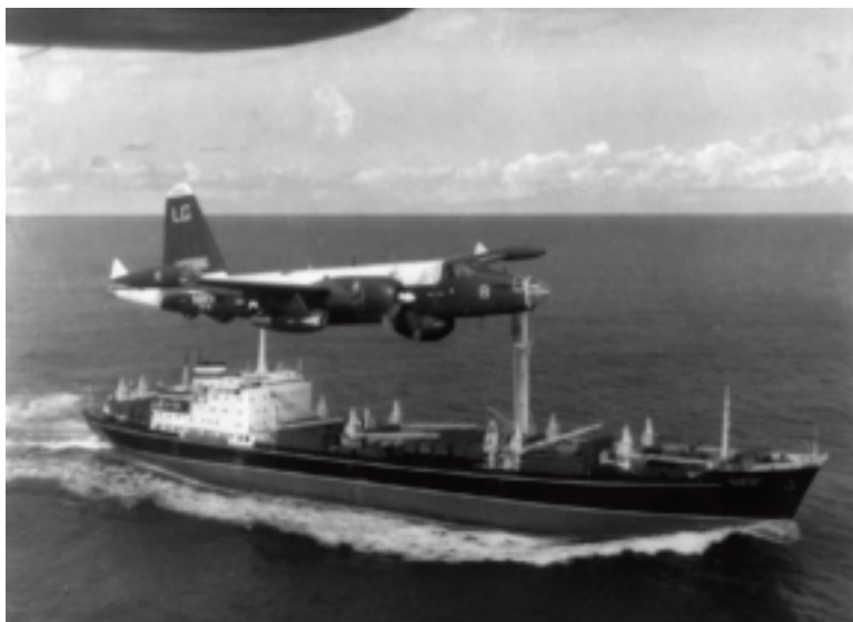
Un avión estadounidense vuela sobre un barco soviético en 1962.

Estados Unidos esperaba combatir el comunismo con el embargo, pero la Unión Soviética quería preservar el comunismo en Cuba. Le ofreció ayuda militar y también comenzó a comprar azúcar de Cuba. Barcos soviéticos llegaban a Cuba con petróleo, medicinas, comida y materiales industriales. El comunismo de Cuba no se colapsó. Al contrario, Castro tomó el control completo de la isla.