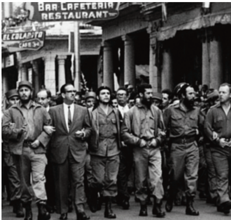
Izquierda a derecha: Fidel Castro, Osvaldo Dorticós Torrado, Che Guevara, y otros revolucionarios marchan en La Habana en 1960